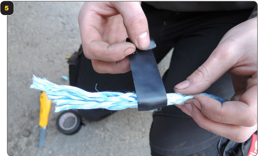
Mit Klebeband abkleben