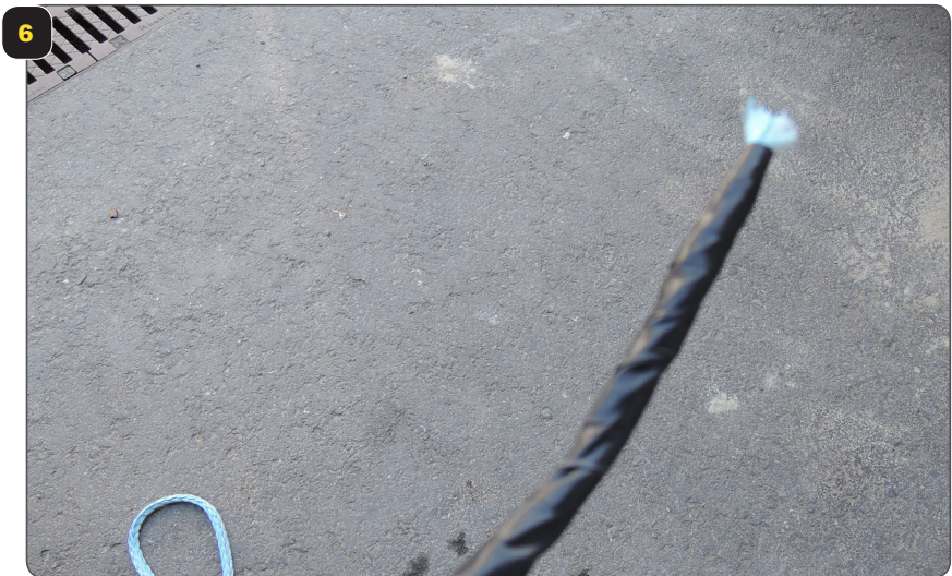
Bis ganz vorne